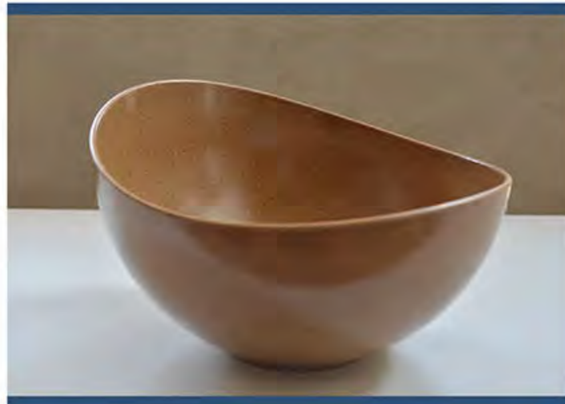
Item n. CG0201 CIOTOLA GRANDE

Pallet Packing quantity: TBD pcs Case packing: TBD