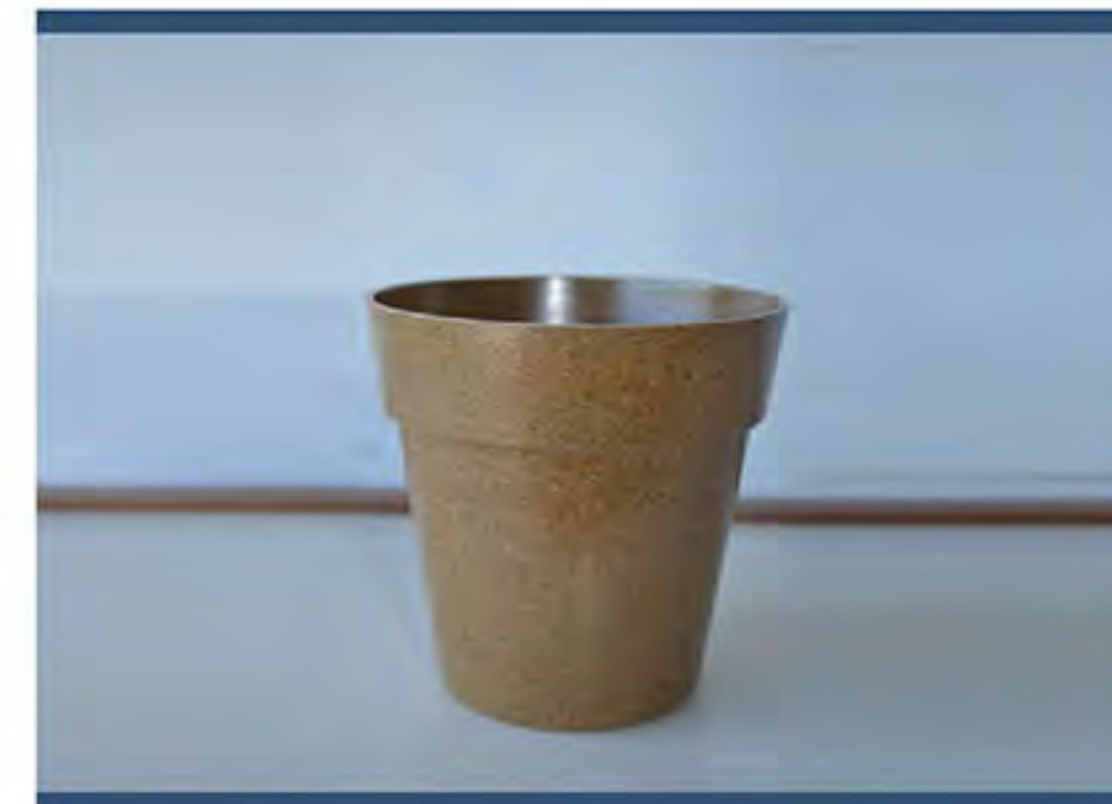
Item n. BI0401 BICCHIERE 200ml

Pallet Packing quantity: TBD pcs Case packing: TBD