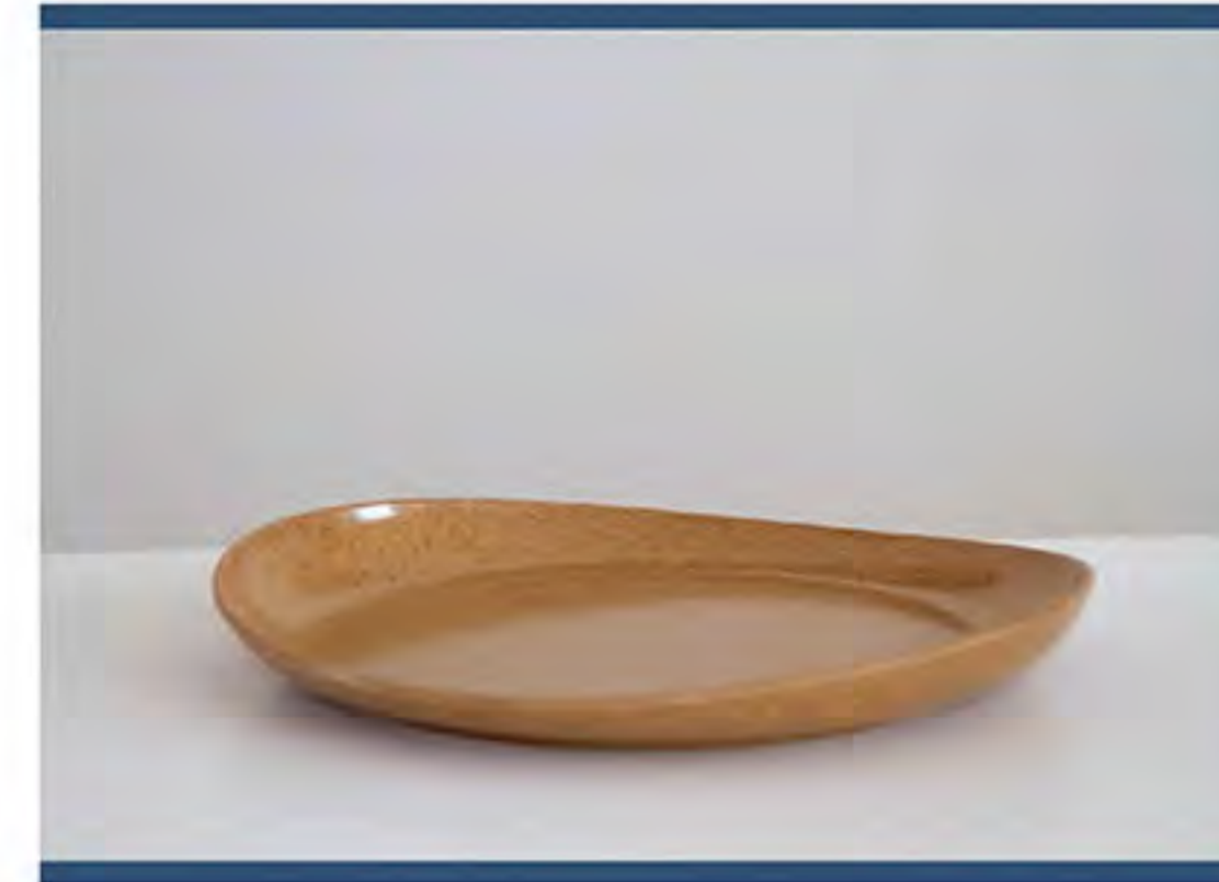
Item n. PP0102 PIATTO PICCOLO

Pallet Packing quantity: TBD pcs Case packing: TBD