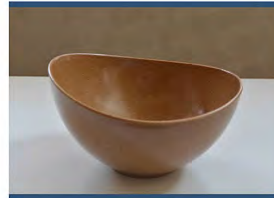
Item n. CP0202 CIOTOLA PICCOLA

Pallet Packing quantity: TBD pcs Case packing: TBD