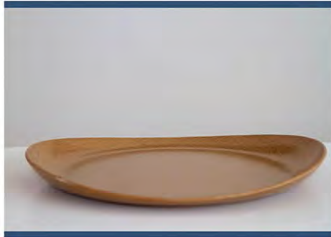
Item n. PG0101 PIATTO GRANDE