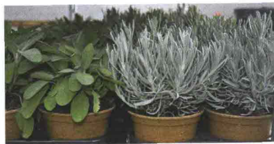
salvia e lavanda